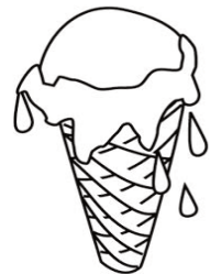
un cornet de crème glacée