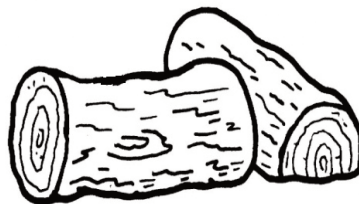
deux bûches de bois