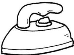
un fer à repasser