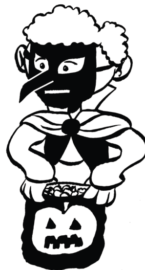
Il porte un masque.

l'araignée l'automne le bonbon la chauve-souris la citrouille le costume le masque novembre la nuit la sorcière le vampire