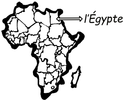
les pays en Afrique

En Afrique, il y a 54 (cinquante-quatre) pays . L'Égypte est un pays dans le continent de l'Afrique.