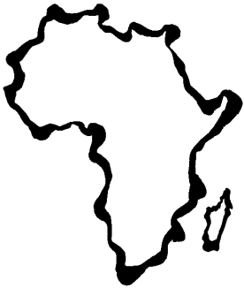
le continent de l'Afrique

L'Afrique est un continent tout comme l'Asie, l'Antarctique, l'Europe, l'Océanie et