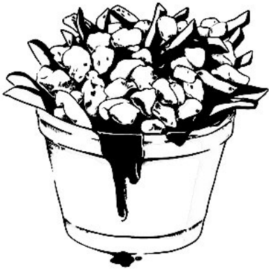
une poutine (féminin)

Voici une liste d'adjectifs qualificatifs. Écris 6 adjectifs qualificatifs pour chacun des trois noms communs suivants: un jeu vidéo (masculin), une poutine (féminin) et un chevalier (masculin).