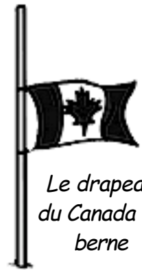
Le drapeau du Canada en berne

Notre drapeau montre la fierté du peuple canadien. Il affirme nos espoirs dans une société juste. L'unifolié (autre nom du drapeau canadien parce qu'il n'a qu'une seule feuille) représente aussi la tristesse lorsqu'il est en berne ou drapé en mémoire d'un(e) Canadien(ne). Notre drapeau a été hissé pour la première fois le 15 février 1965 à Ottawa. En 2015, le drapeau a eu 50 ans. Cette année, le drapeau a donc _____ ans.